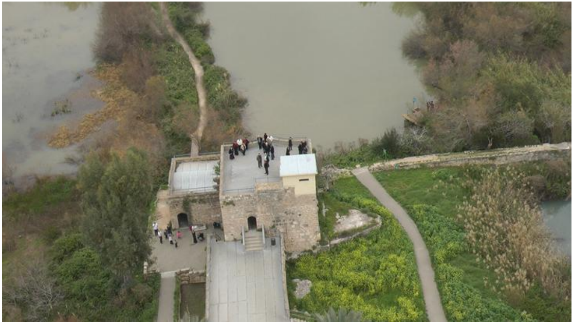
אפק תחנת הקמח הצלבנית

מקור השם "אפק" הוא מאכדית – מעיין. אם השם מוכר זה בין היתר כי השם ניתן למספר מקומות בארץ: תל אפק ומעיינות ראש העין (עליו יש כבר כתבה), אפיק ברמת הגולן, ושמורת מעיינות אפק. בטיסותינו אנו רגילים לראות מצודות, ארמונות, חומות ושרידי עבר ציבוריים אחרים, כאשר איננו נחשפים כמעט לאתרים מחיי היום יום. בטיסה זו נוכל לראות שמורת עין אפק - חווה חקלאית מהתקופה הצלבנית. זוהי נקודת חן אמתית מזרחית לקריית ביאליק, בין הקישון לנעמן, המעוררת כמיהה לימים בהם שלטו הביצות באדמת הארץ. ריאה ירוקה ורטובה זו היא שריד אחרון לביצות נחל נעמן, שיובשו בשנות ה-40 של המאה ה-20, בפרץ התלהבות חלוצי.