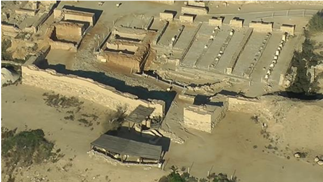
שער העיר והמחסנים ובאר המים לפני השער

המצודה שאנו רואים היום היא המצודה השנייה שנבנתה על חורבות הקודמת לה. זו מצודה קטנה המוקפת חומה באורך של כ-400 מטר ובה שער.