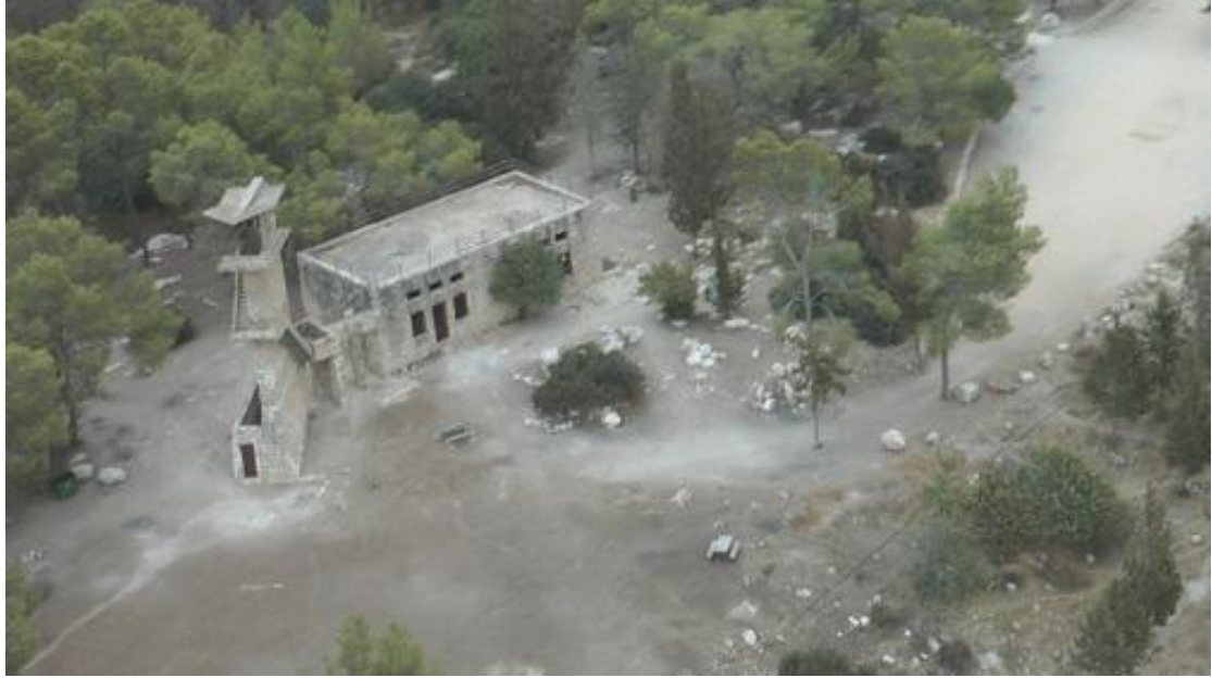
מצפה הראל ודרך בורמה