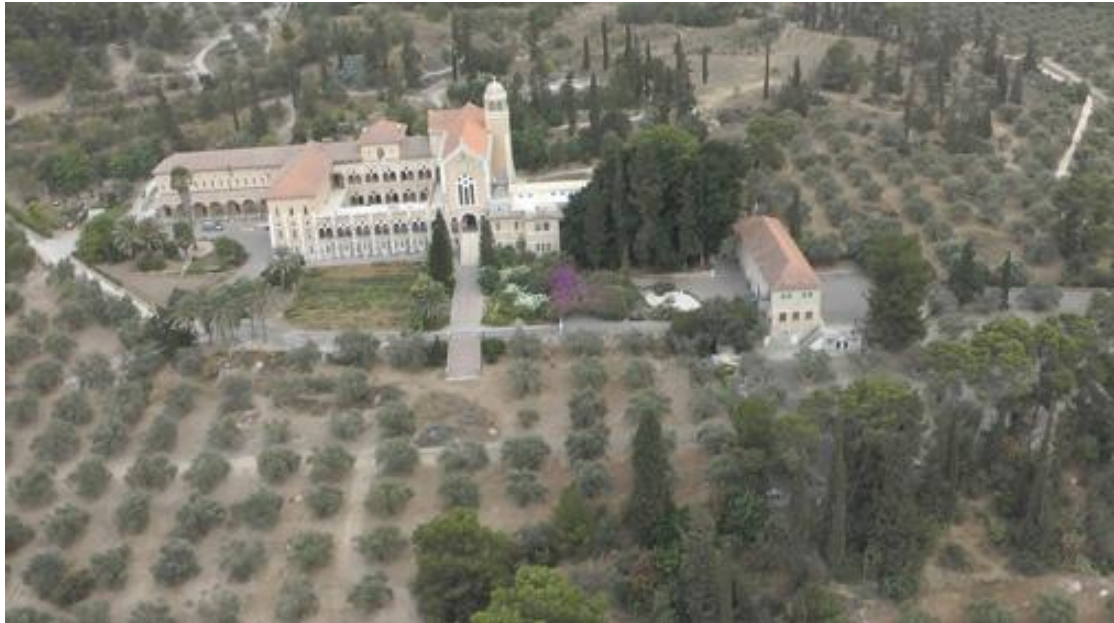
מנזר לטרון (מנזר השתקנים)