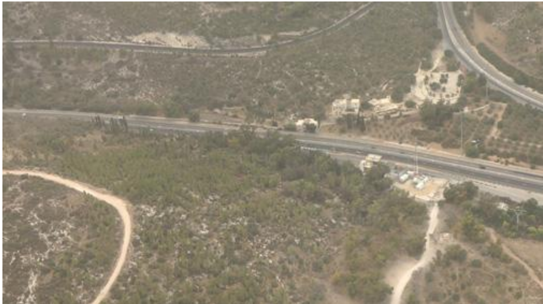
שער הגיא מעליו מתחיל רכס שיירות