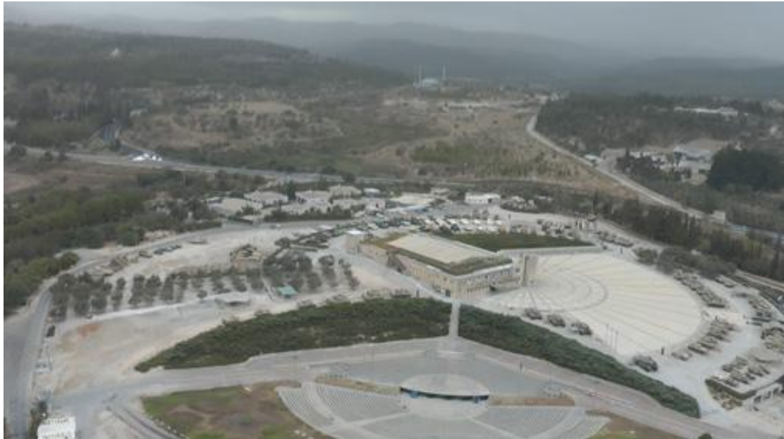
משטרת לטרון כיום מוזיאון השריון

בשנת 1980 הוכרזה משטרת לטרון כאתר ההנצחה הרשמי של חיל השריון. המראה החיצוני של מבנה המשטרה נשמר ובתוכו שוכן מוזיאון גייסות השריון. מוזיאון השריון הוא מהגדולים בעולם. המוזיאון כולל קיר הנצחה לכ - 4800 אנשי חיל השריון שנפלו במלחמות ישראל, סיפור חייהם ומותם ועל קירותיו מוקרנים תמונות חללי השריון. מסביב למבנה המשטרה מוצגים מעל ל - 200 טנקים ורכבים קרביים משוריינים מכל התקופות, מכל צבאות העולם, כולל טנקים ורכבים משוריינים שנפלו שלל מצבאות ערב במלחמות ישראל. באתר גם אמפיתיאטרון גדול המשמש בעיקר לטקסים צבאיים.