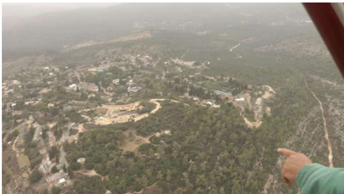
המסרק ובית מאיר (בית מחסיר)

כיום נותרה במקום שמורת הטבע, אותה החליטו לשמר, בגלל שרידי האורנים המרשימים; המסרק הוא מעין חלון לנוף עבר. במקרה שלנו נשמר המקום בשל קדושתו למוסלמים - קבר השייח אשר במרכזו.