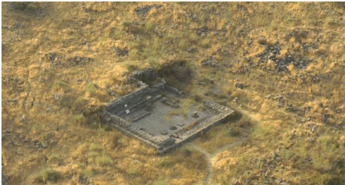
בית הכנסת בנשוט

רמת הגולן היא שטח קטן יחסית; יחד עם זאת, במהלך סקרים וחפירות ארכיאולוגיות התגלו כאן שרידיהם של עשרים וחמישה בתי כנסת עתיקים! מדובר על שליש מסך כל בתי הכנסת שנמצאו בארץ כולה! בתי הכנסת הראשונים נבנו בתקופת בית המקדש השני, אז שימשו כמבני ציבור לכינוס ולצרכים קהילה שונים, כמעט כמו המתנ"ס של ימינו. את בתי הכנסת הללו ניתן לספור על יד אחת. אחד מהם הוא בית הכנסת שנמצא בגמלא, אותו הזכרנו במאמר הקודם. חורבן הבית השני היכה את יהודי ארץ ישראל בהלם. חסרון המקדש הורגש בכל תחומי החיים. מנהיגי הדור ניסו לשקם את החיים היהודיים, וכך במשך דורות, נבנו בתי כנסת בישובים יהודיים בארץ ובתפוצות שהחליפו במעט את מקום המקדש בחיי העם. בית הכנסת הפך למקום קודש של תפילות וקריאה בתורה. בבתי הכנסת של ימינו הפרדה ברורה בין גברים ונשים; האם כך היה בימי קדם? באשר לקיומה של עזרת נשים בבתי הכנסת העתיקים חלוקת הדעות. מקורות התקופה מספרים על השתתפותן של נשים בתפילה, אך ככל הנראה, ממש כמו בבית המקדש גופו, לא הייתה הפרדה פיזית בין המינים.