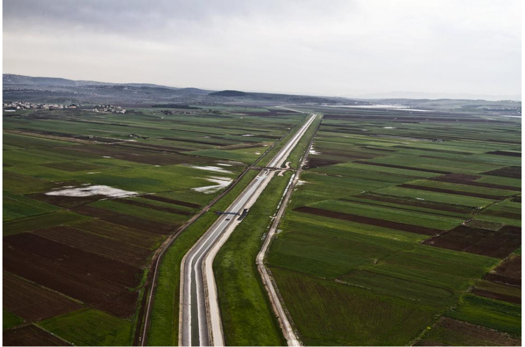
המוביל הארצי הפתוח

תעלה זו היא תעלה פתוחה, הנמתחת לאורכם של כ-16 ק"מ בשוליה הצפוניים של הבקעה. התעלה מובילה את מי הירדן לשני מאגרים בקצה הדרומי של הבקעה, הנקראים "אגמי אשכול" (על שם לוי אשכול, מנכ"ל "מקורות" בשנות ה-50, וראש ממשלת ישראל בשנות ה-60). האחד, "מאגר שיקוע", תפקידו תברואתי-שיקוע הרחופת במים. ממאגר זה מועברים המים באיטיות למאגר השני, שתפקידו תפעולי. כאן מווסתת כמות המים המגיעה מן התחנות והתעלות הפתוחות, ונכנסת לצינור סגור שאורכו 86 ק"מ והמגיע לראש העין.