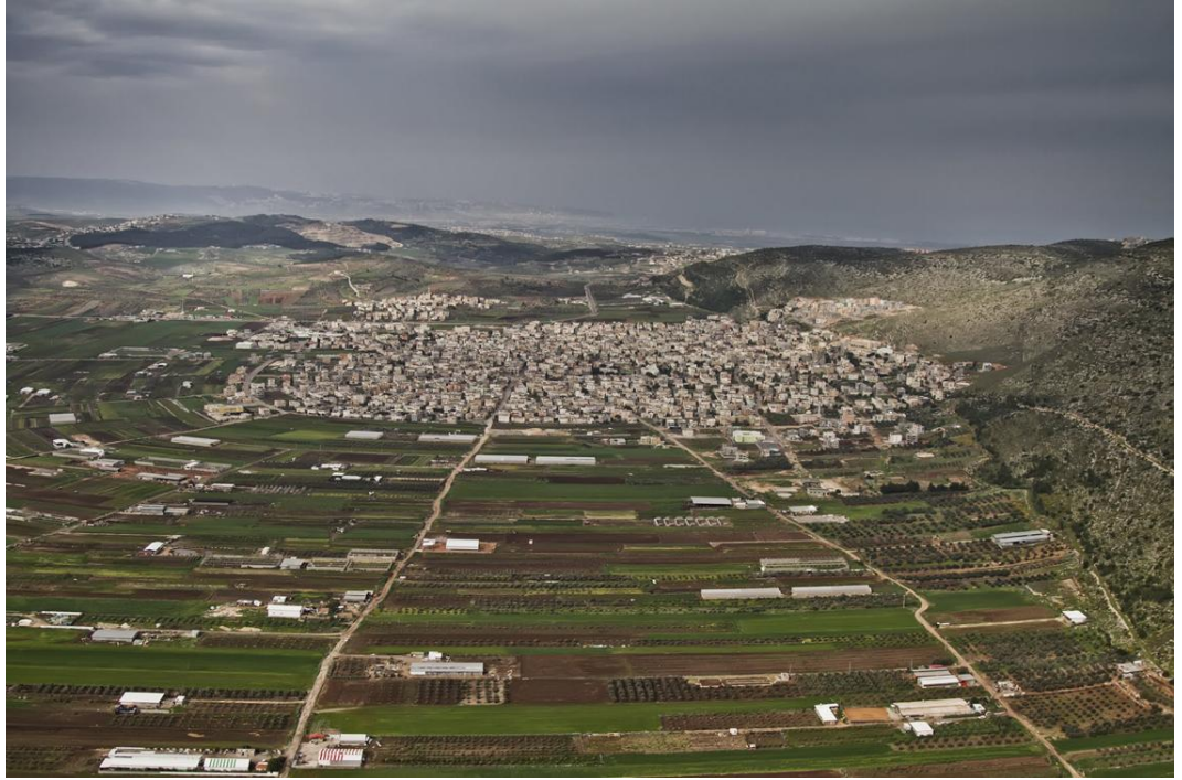
כפר מנדה