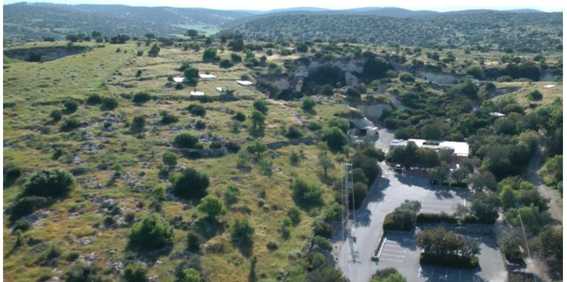
מערות בית גוברין

המערות. המערות יוצרות מבוך ענק של אולמות וחללים גדולים מתחת לפני הקרקע. האזור משתרע על פני כ-5,000 דונם. הסלע רך אך עמיד יחסית לבליה, ובאזור נתגלו מערות שחצב האדם כבר בימי קדם לשימושים שונים ומגוונים: מחצבות, מערות קבורה, מחסנים ובתי מלאכה, מחילות מסתור וכפי שראינו- גידול יונים.