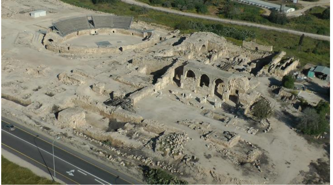
בית גוברין מימין הכנסייה הצלבנית משמאל האמפיתאטרון הרומי