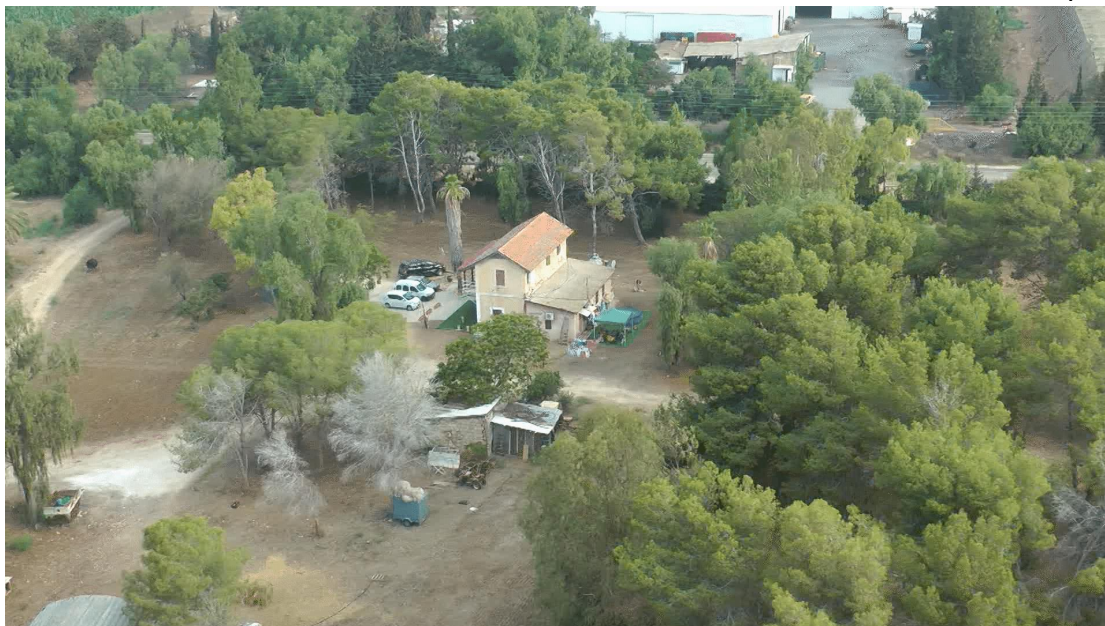
חנות הניסיונות בעתלית

בכדי לשחות בסבך הסיפורים, ראשית נכיר בקצרה את הסיפור המרכזי, ולאחר מכן נרחיב אודות חלקים מאותו הסיפור הנפגשים עם הסיפורים האישיים של כל אחת מהדמויות.