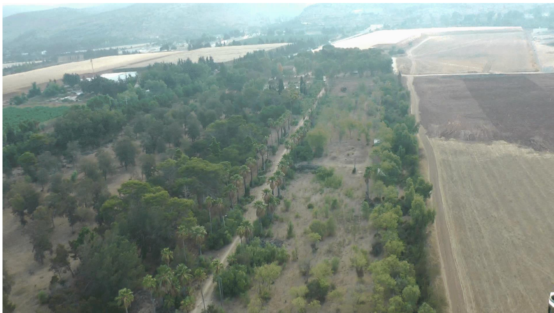
חוות הניסיונות בעתלית שדרת הוושניגטוניות למזח בעתלית