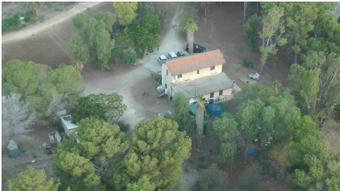
חוות הניסיונות בעתלית

בין השנים 1910 ו-1915 החליף אבשלום עם שתי האחיות עשרות מכתבים (תוכנם מרתק ונוגע לעניינים אחרים בארץ ישראל). אין לי ספק כי הוא אהב את שתיהן ובהחלט הייתה סיבה לחשוד בו כי היה אף מאורס לרבקה. אולם נשאלת תמיד השאלה: למי כתב אבשלום את מכתב האהבה הלוהט? לרבקה הצעירה והגינג'ית או לאחותה שרה בהירת השיער?